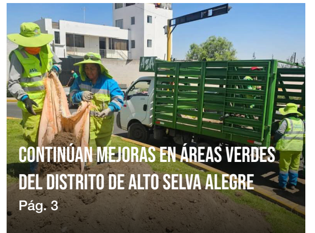
CONTINÚAN MEJORAS EN ÁREAS VERDES DEL DISTRITO DE ALTO SELVA ALEGRE Pág. 3