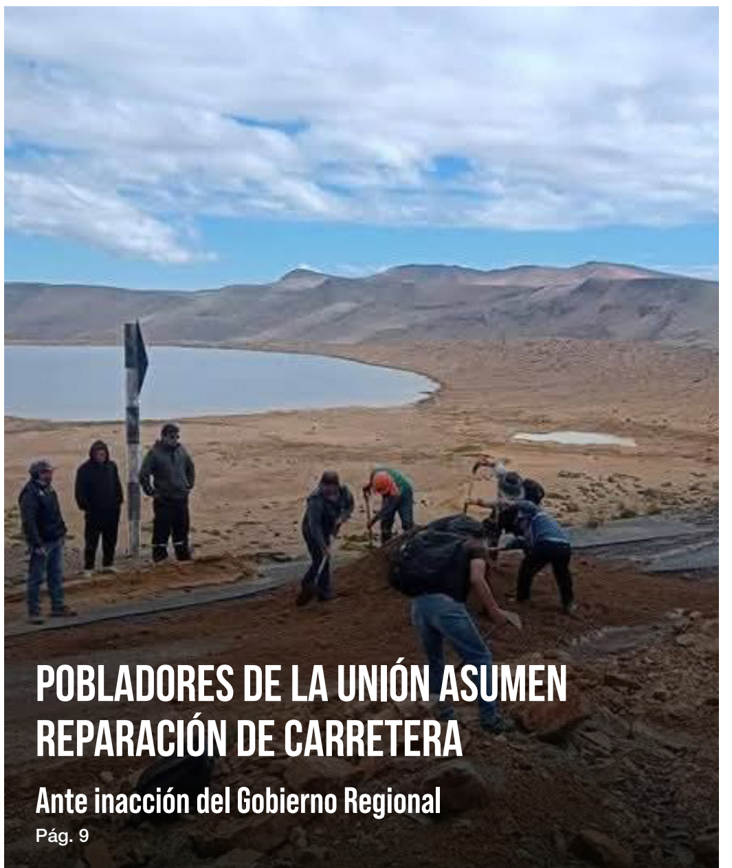
POBLADORES DE LA UNIÓN ASUMEN REPARACIÓN DE CARRETERA Ante inacción del Gobierno Regional Pág. 9