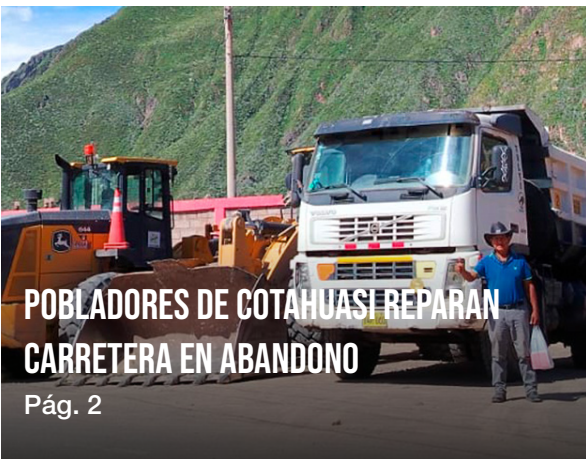
POBLADORES DE COTAHUASI REPARAN CARRETERA EN ABANDONO Pág. 2