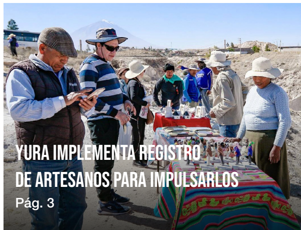
YURA IMPLEMENTA REGISTRO DE ARTESANOS PARA IMPULSARLOS Pág. 3