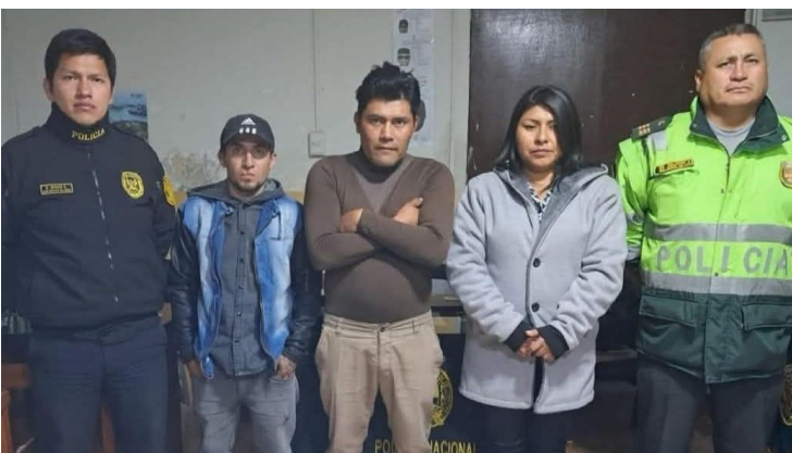
CERCADO DE AREQUIPA Detienen a dos hombres y una mujer por robo a personas en estado de ebriedad Pág. 6