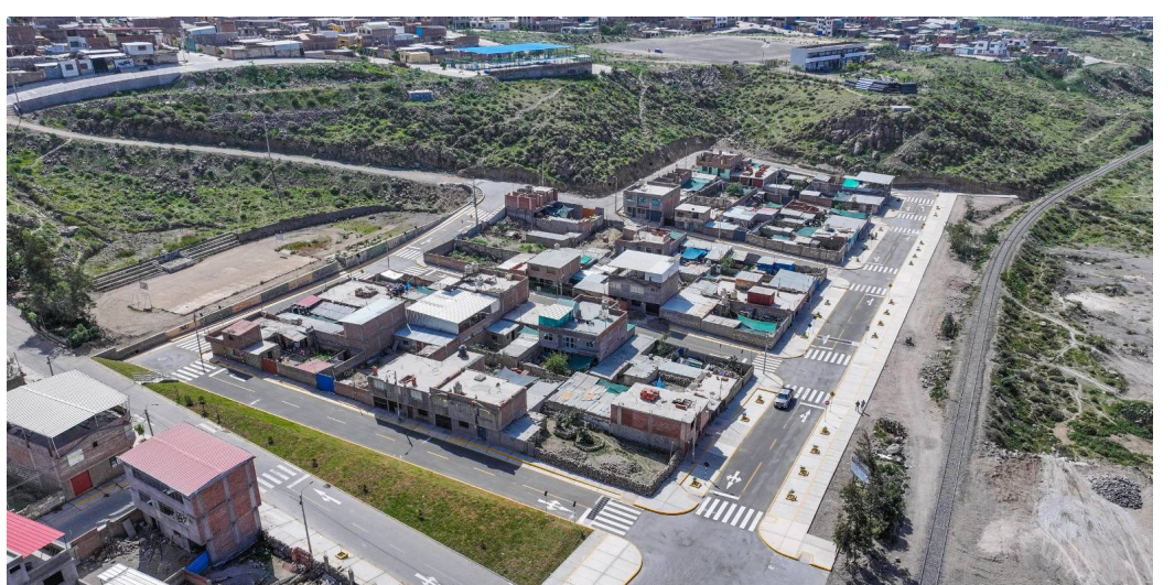
YURA: 5 OBRAS POR MÁS DE S/ 36 MILLONES Alcaldesa Mirtha Ruelas Casillas impulsa obras con el compromiso de mejorar la calidad de vida de la población Pág. 15