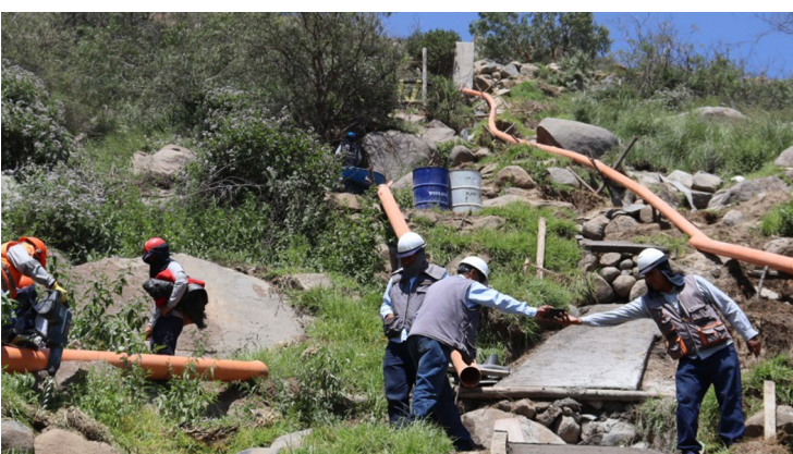
YARABAMBA Ejecuta proyecto de riego por más de S/ 14 millones Pág. 12