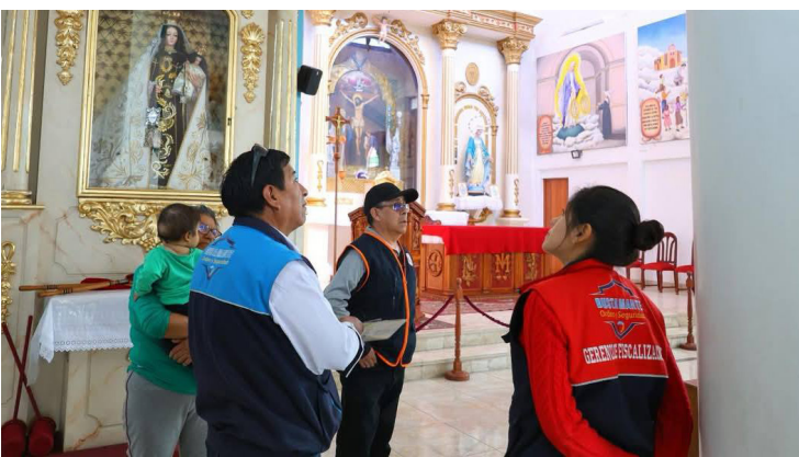
JOSÉ LUIS BUSTAMANTE Y RIVERO Inspecciona medidas de seguridad en iglesias por semana santa Pág. 4