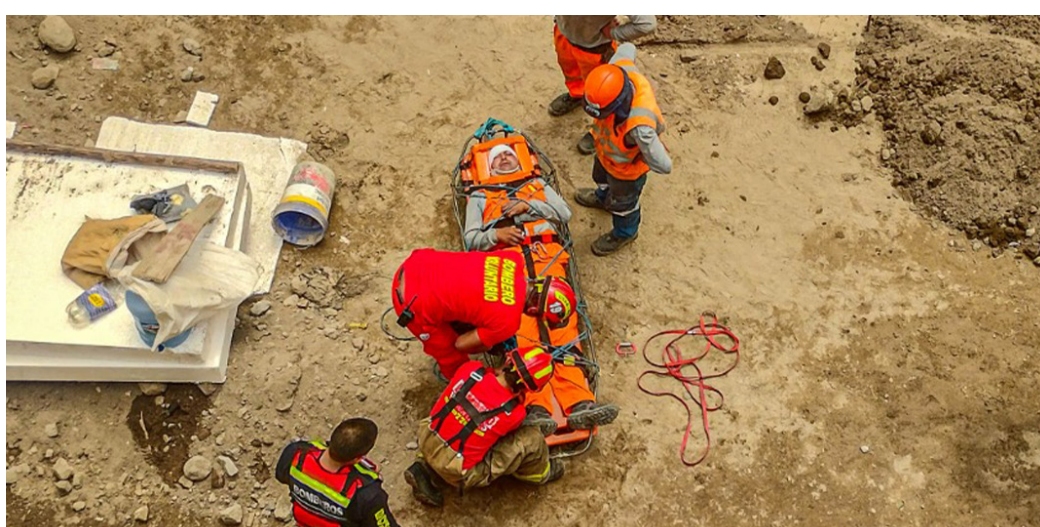
ACTO VIOLENTO EN CONSTRUCCIÓN DE MURO Ataque en obra de San Lázaro deja a obrero herido tras irrupción de presunto grupo sindical Pág. 13