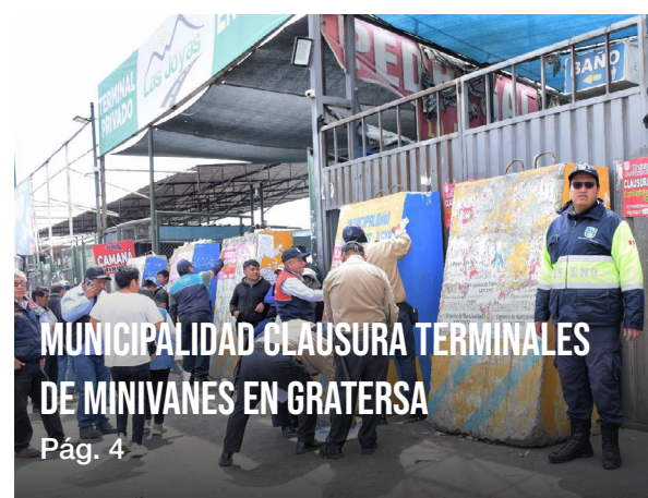
MUNICIPALIDAD CLAUSURA TERMINALES DE MINIVANES EN GRATEROSA Pág. 4