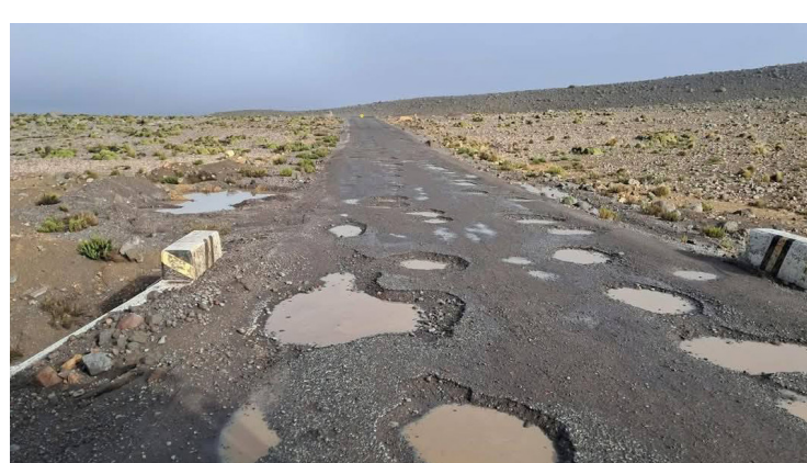
COTAHUASI - CHUQUIBAMBA Carretera se encuentra en el olvido del Gobierno Regional de Arequipa Pág. 7