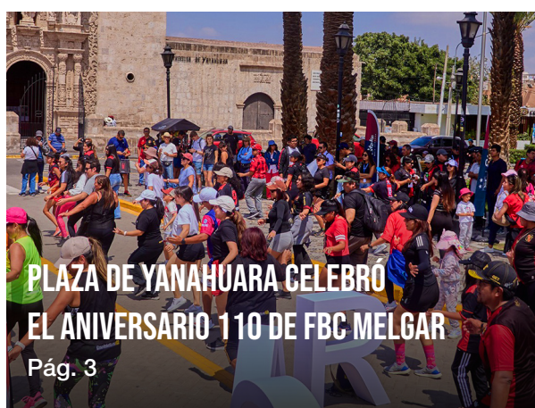
PLAZA DE YANAHUARA CELEBRÓ EL ANIVERSARIO 110 DE FBC MELGAR Pág. 3