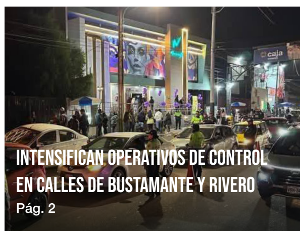
INTENSIFICAN OPERATIVOS DE CONTROL EN CALLES DE BUSTAMANTE Y RIVERO Pág. 2