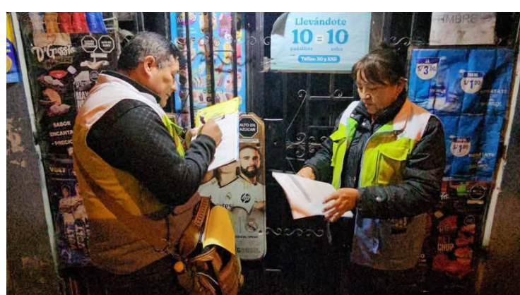
ALTO SELVA ALEGRE Municipalidad intensifica operativos para hacer cumplir normativa en licorerías Pág. 4