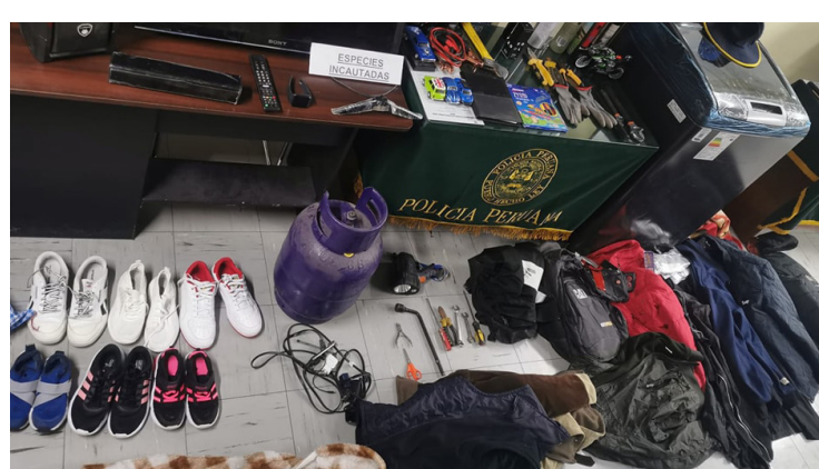
CERRO COLORADO Policía captura a "Los sagaces de la ciudad blanca" tras asalto Pág. 8