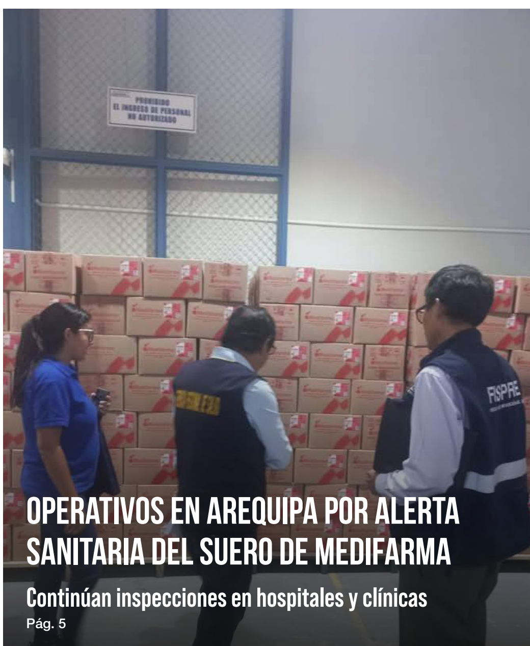
OPERATIVOS EN AREQUIPA POR ALERTA SANITARIA DEL SUERO DE MEDIFARMA Continúan inspecciones en hospitales y clínicas Pág. 5