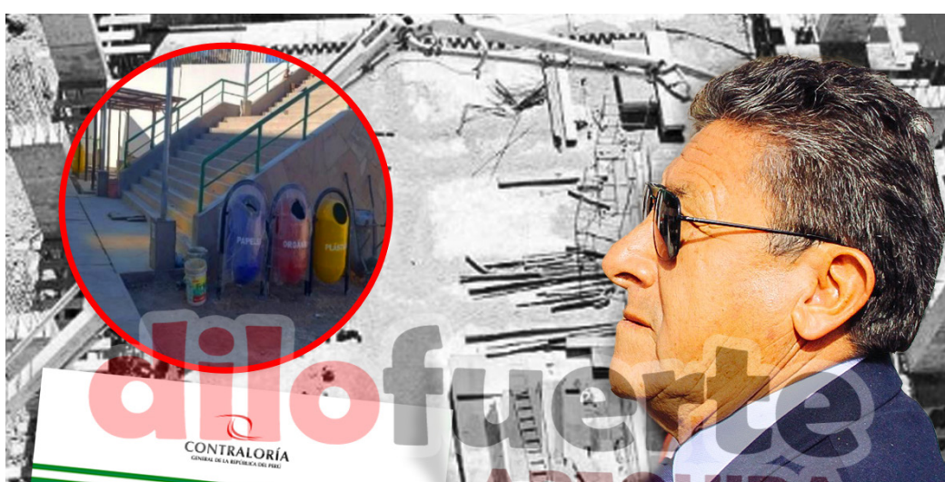
COMPLEJO DEPORTIVO EN TIABAYA BAJO LA LUPA Una reciente acción de control concurrente de la Contraloría detecta retrasos y riesgos financieros Pág. 4