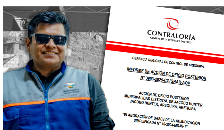
HUNTER Contraloría revela irregularidades en bases de licitación pública Pág. 7