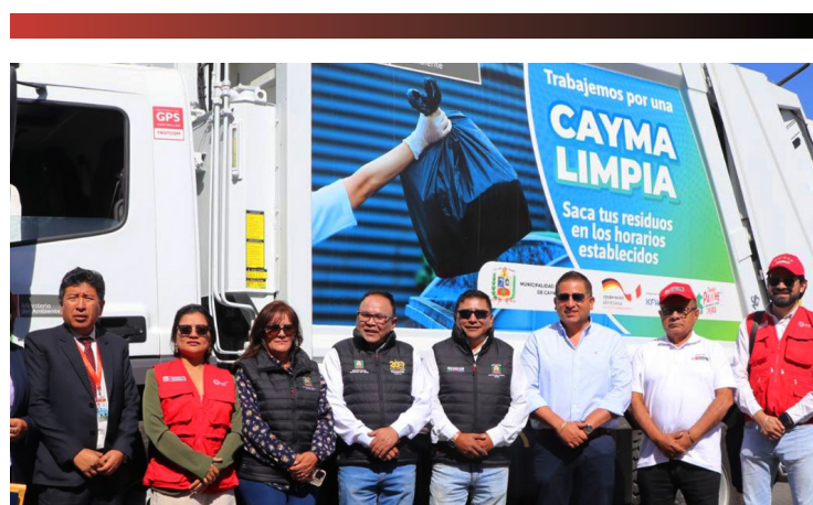
CAYMA Realiza servicio de limpieza con llegada de nuevas compactadoras Pág. 6