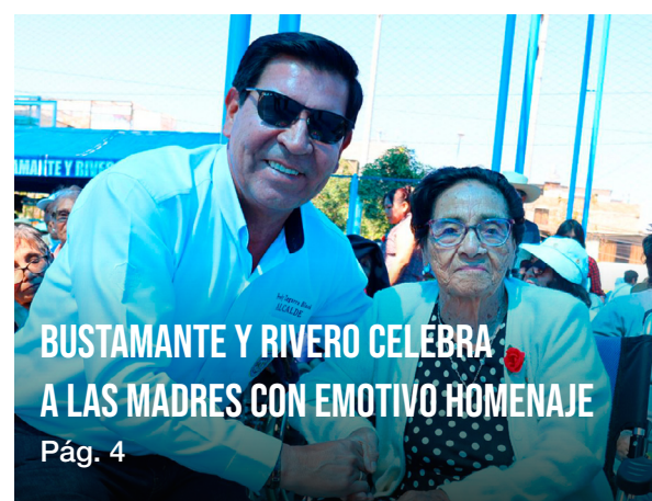
BUSTAMANTE Y RIVERO CELEBRA A LAS MADRES CON EMOTIVO HOMENAJE Pág. 4