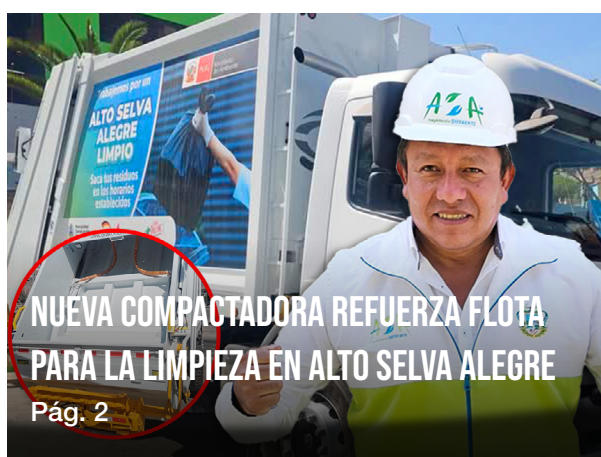
NUEVA COMPACTADORA REFUERZA FLOTA PARA LA LIMPIEZA EN ALTO SELVA ALEGRE Pág. 2