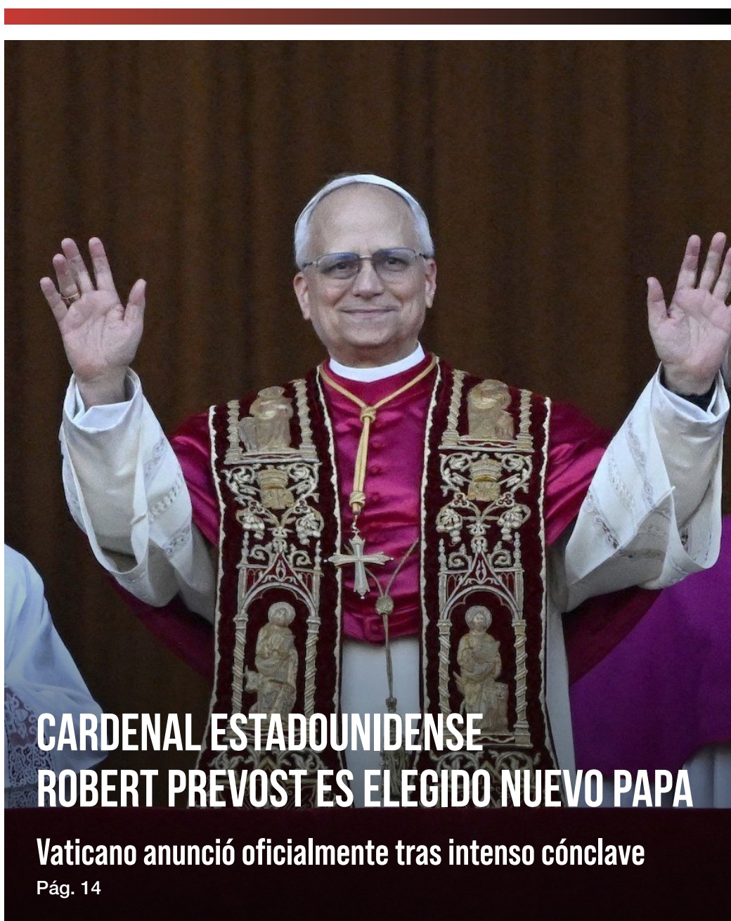
CARDENAL ESTADOUNIDENSE ROBERT PREVOST ES ELEGIDO NUEVO PAPA Vaticano anunció oficialmente tras intenso cónclave Pág. 14