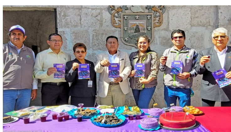
YARABAMBA Presenta conferencia de prensa por el Día nacional de la papa y maíz morado Pág. 5