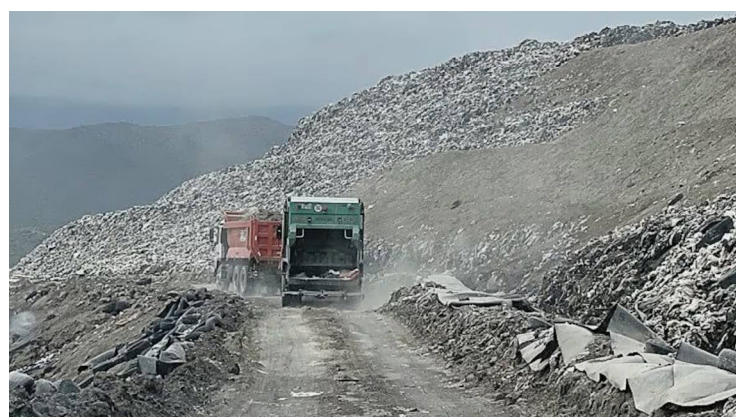
ACUMULACIÓN DE RESIDUOS Va en aumento cada año en la ciudad de Arequipa Pág. 7