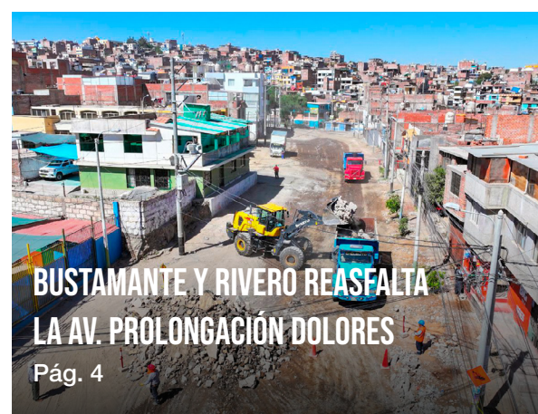
BUSTAMANTE Y RIVERO REASFALTA LA AV. PROLONGACIÓN DOLORES Pág. 4