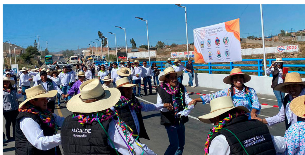
INAUGURAN PUENTE QUEBRADA HONDA Obra esperada es una realidad. Mejorará la conectividad entre Yarabamba, Quequeña, Polobaya y más. Pág. 10