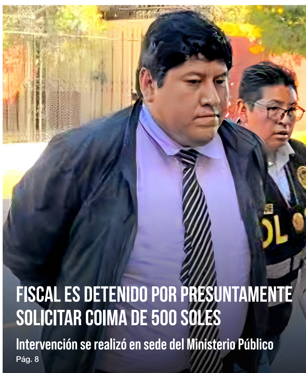
FISCAL ES DETENIDO POR PRESUNTAMENTE SOLICITAR COIMA DE 500 SOLES Intervención se realizó en sede del Ministerio Público Pág. 8