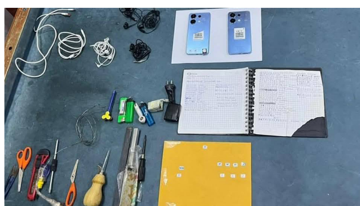
OPERATIVO POLICIAL EN SOCABAYA Policía Nacional del Perú haya celulares, drogas y armas blancas en penal Pág. 6