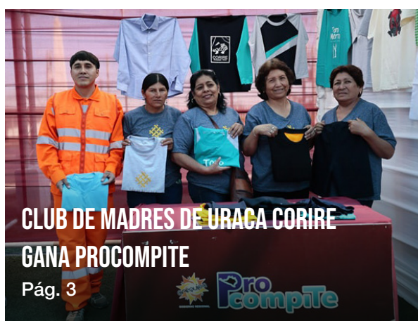
CLUB DE MADRES DE URACA CORIRE GANA PROCOMPITE Pág. 3